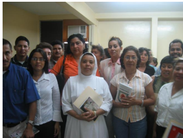
Parte de los profesores y profesoras que participaron en el Seminario-Taller.

De igual manera, en la evaluación escrita, los participantes manifestaron una alta satisfacción por la calidad de los expositores. Proponen la continuidad de la formación a través de capacitaciones especialmente desarrollando un DIPLOMADO EN CIENCIAS SOCIALES.