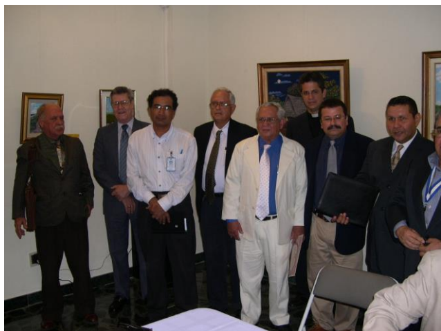
Nuevos Miembros de la AGHN