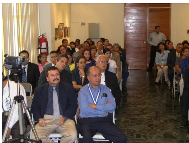
Parte de los asistentes al Acto de Incorporación