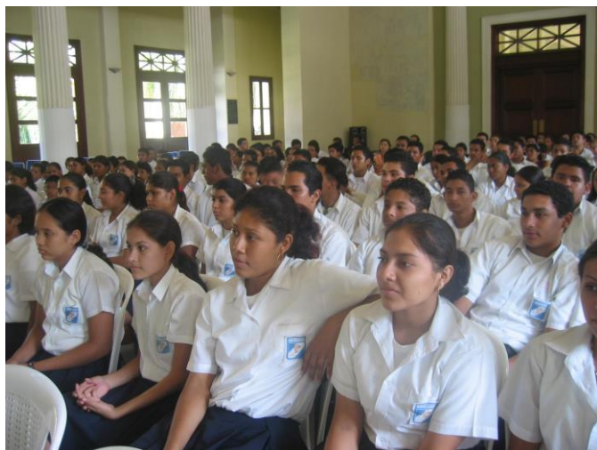
Parte de los alumnos y alumnas participantes en las conferencias

Las conferencias fueron acompañadas con actos culturales. Participaron estudiantes de secundaria de distintos colegios de Managua.