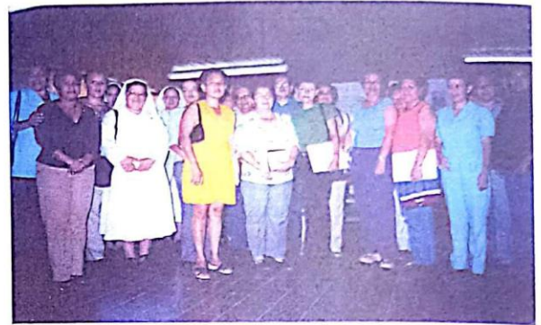
Profesores y Profesoras de Ciencias Sociales que participaron en el Seminario-Taller "La importancia de la enseñanza-aprendizaje de la Historia y la Geografía"

Participaron Profesoras y Profesores de los distintos colegios, entre ellos: Colegio Roberto Clemente, Colegio La Salle Jinotega, Instituto Pedagógico La Salle (Managua), Colegio Parroquial San Antonio, Ciudad Darío, Instituto Loyola, Colegio Sagrado Corazón de Jesús (Jinotega), Colegio Teresiano (Managua), Colegio San Francisco de Asís (Juglalpa), Oficina Nacional Fé y Alegría, Colegio Santa Teresita-Matagalpa y Directivos (as) de la Federación de Colegios Católicos.