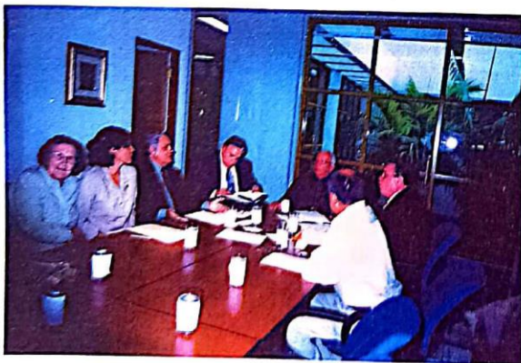
Junta Directiva en sesión ordinaria