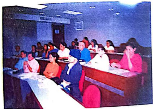
Alumnos del Diplomado en Historia

Por ello se destaca en los contenidos el aspecto cultural no como un aspecto accesorio sino como un elemento que aporte al conocimiento los rasgos propios de la sociedad que ha compartido la paternidad de todos aquellos acontecimientos históricos que han afectado a todas las generaciones precedentes.