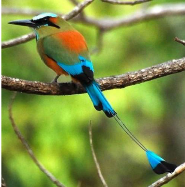
El Guardabarranco: Ave Nacional