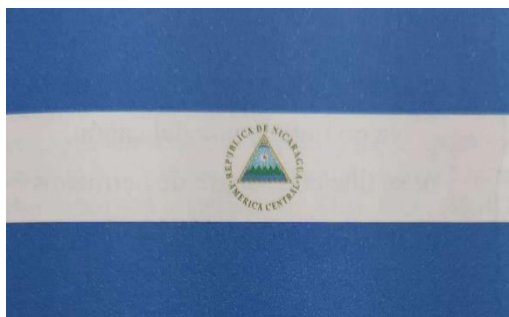
Bandera de la República de Nicaragua, promulgada por Decreto de la Asamblea Nacional Legislativa, el 4 de septiembre de 1908.