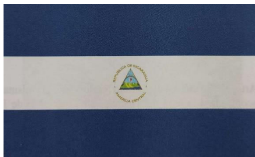
Bandera de la República de Nicaragua, aprobada por Decreto Legislativo del 23 de agosto de 1971.