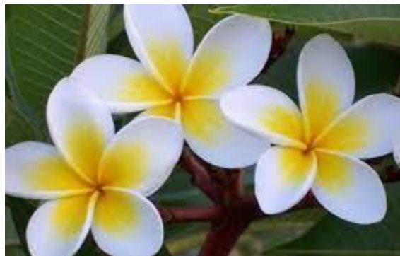
El Sacuanjoche: Flor Nacional

El Sacuanjoche, científicamente denominado " Plumeria Rubra Acutifolia ", es voz azteca, según la definición del recordado investigador general Alfonso Valle, descompuesta así: "zacuani": amarillo; "xochitl": flor.