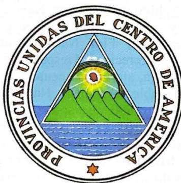
Escudo de Armas de las "Provincias Unidas del Centro de América", promulgado el 21 de agosto de 1823, por la Asamblea Nacional Constituyente de Centro América.

Promulgado el 21 de agosto de 1823 por la Asamblea Nacional Constituyente de Centro América, consistía en un triángulo equilátero en cuya base aparecía una cordillera con cinco volcanes colocados sobre un terreno que se figura bañado por ambos mares; en la parte superior, un arco iris cubriéndolos y bajo el arco, el gorro de la libertad esparciendo luces. En torno del triángulo y en figura circular aparecía una leyenda con letras de oro: "Provincias Unidas del Centro de América".