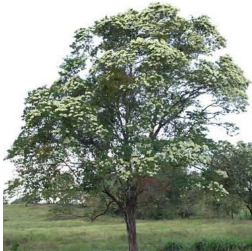
El Madroño: Árbol Nacional

Crece en México, Cuba, Centro América y hasta la parte norte de la América del Sur, con altura media de 15 a 20 metros; de ramas flexibles, color rojo marrón, lustrosas, generalmente con escamas. La madera es pesada, fuerte, de grano fino, elástica y fácil para ser elaborada; se emplea para mangos de herramientas, postes, leña y carbón. En los Estados Unidos se fabrican arcos con ella.